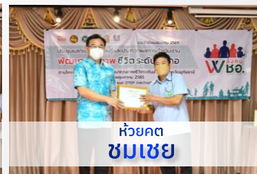
ห้วยคต ชมเชย