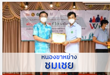
หนองขาหย่าง ชมเชย