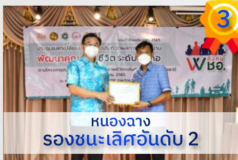
หนองวาง รองชนะเลิศอันดับ 2