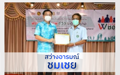
สว่างอารมณ์ ชมเชย