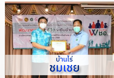
บ้านไร่ ชมเชย