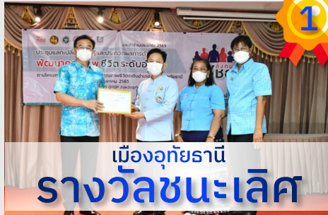
เมืองอุทัยธานี รางวัลชนะเลิศ

จัดประชุมแลกเปลี่ยนเรียนรู้และประกวดผลการดำเนินงานพัฒนาคุณภาพชีวิตระดับอำเภอ ตามโครงการขับเคลื่อนการพัฒนาคุณภาพชีวิตระดับอำเภอ จังหวัดอุทัยธานี วันที่ 20 พฤษภาคม 2565