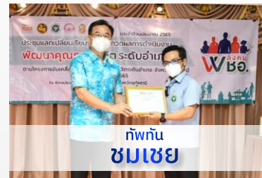
ทัพทัน ชมเชย