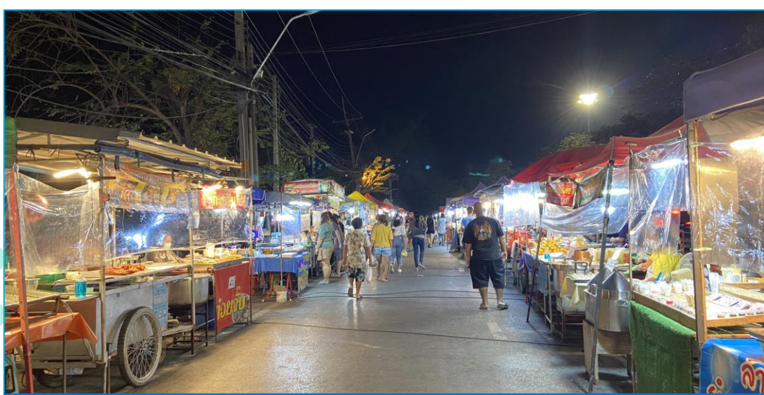
อาหารริมบาทวิถี Street Food ตลาดหน้าองค์การโทรศัพท์