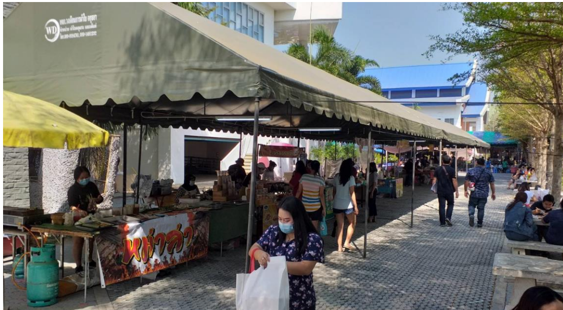
ตลาดนัด ตลาดนัดน้ำซ้อ ตลาดนัดมหาวิทยาลัยราชภัฏพระนครศรีอยุธยา