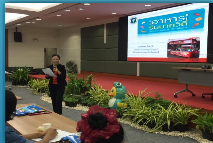
แผนปฏิบัติงานเฝ้าระวังสุขาภิบาลอาหาร ตามโครงการสุขาภิบาลอาหารในสถานที่จำหน่ายสินค้าในที่/ทางสาธารณะ วันที่ ๑๔ - ๒๔ กุมภาพันธ์ ๒๕๖๔