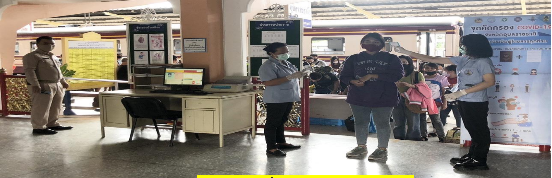
คัดกรองที่สถานีรถไฟ / บ.ข.ส.